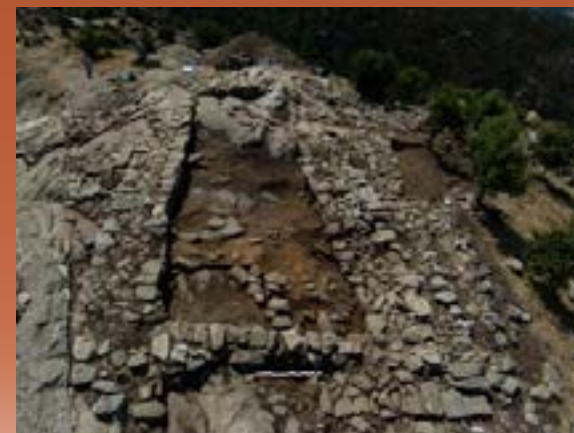
La tour du X e s. bâtie sur un premier bâtiment culinaire

La tour, à laquelle on accédait par l'étage, est ancrée sur une butte rocheuse de 600 m 2 (20 x 30 m). Bénéficiant d'une mise en scène topographique (parois rupestres accentuant l'élévation), elle a été bâtie sur les vestiges d'une cuisine du IX e s. Elle remplit, au X e s., une fonction de vigie (alerte) et de cellier. Visible de tous côtés et depuis la plaine, elle symbolise la juridiction castrale à l'aube de la seigneurie châtelaine.