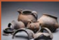
Pots globulaires du X e s.