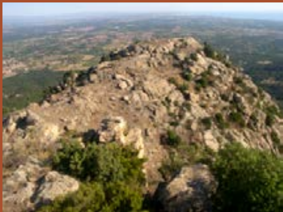
Un promontoire rocheux surplombant le Roussillon

Fondé au V e s. de notre ère, qualifié en l'an 672 de castrum par Julien de Tolède et occupé jusqu'au X e s., Ultréra est un grand site du haut Moyen Âge méridional, exceptionnel par sa durée d'occupation sous l'ère de domination wisigothique et carolingienne. Bâti sur une éminence granitique et s'organisant en plusieurs quartiers répartis dans 3 hectares pentus et rocailleux, il surplombe les vallées encaissées du massif des Albères et le littoral du Roussillon.