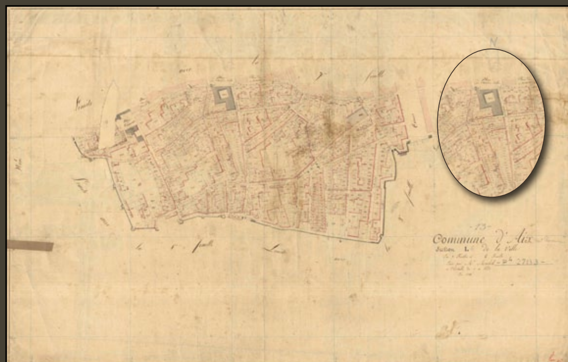
les abords immédiats de l'Hôtel de ville au début du XIX e siècle. Détail du cadastre napoléonien, 1828.

À son emplacement est aménagée une petite place triangulaire pavée et plantée d'arbres. Il faut cependant attendre 1903-1905 pour que les deux façades mises à nu reçoivent une décoration architecturale conforme au style du monument.