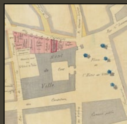
Pâté de maisons appuyé contre l'aile septentrionale de l'Hôtel de ville, 1876.