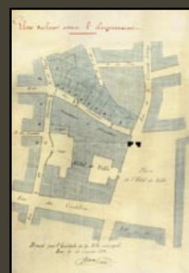
L'Hôtel de ville après le dégagement de l'aile ouest (rue de la verrerie), 1882. Archives municipales, Aix-en-Provence.