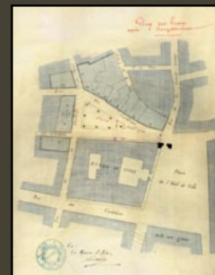
Le dégagement de l'Hôtel de ville après la démolition des maisons adossées côté rue des cardeurs, 1882.