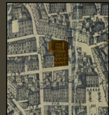
L'Hôtel de ville avant l'agrandissement de 1755. Détail du Plan Devoux, 1741. Bibliothèque Méjanes, Aix-en-Provence.