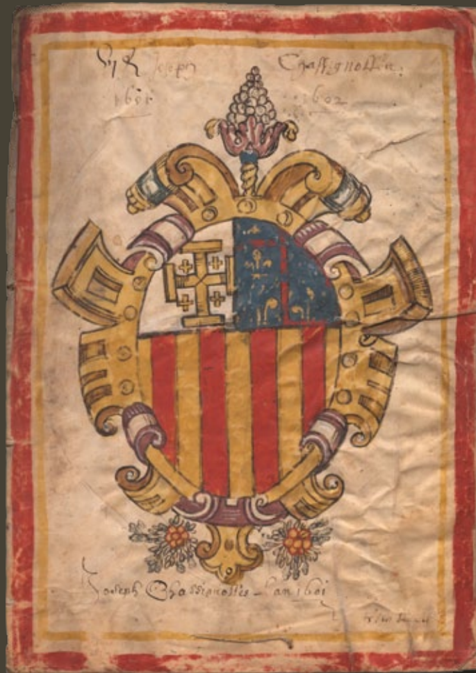
Blason ornant le registre des délibérations municipales, 1601.

En 1755, le corps sud de l'édifice est agrandi par l'incorporation de deux maisons de la rue Esquicho Mousco (actuelle rue des Cordeliers).