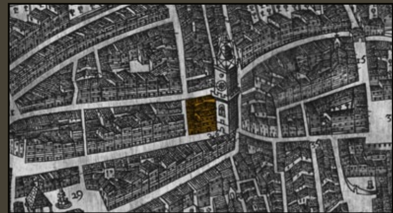
L'hôtel de Ville rebâti en 1539. Détail du Plan Marez, 1622. Bibliothèque Méjanes, Aix-en-Provence.