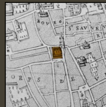
L'Hôtel de ville reconstruit de 1655 à 1670. Détail du plan Cundier, 1680. Bibliothèque Méjanes, Aix-en-Provence.