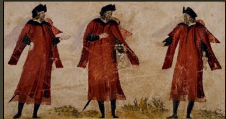
Les consuls de la Ville. Détail du Liber consulum, 1600. Archives, Municipales, Aix-en-Provence.