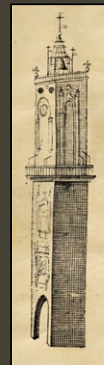
Tour de l'horloge au XVIII e siècle. Détail du plan Devoux 1753.