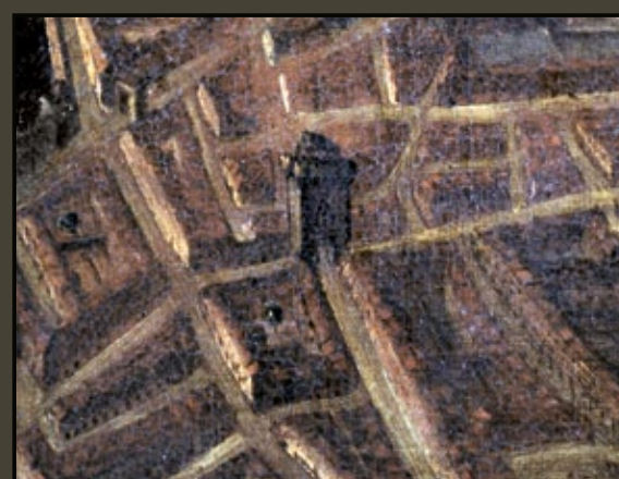
illustration la tour de l'horloge et ses éléments défensifs. Détail de la peinture représentant le siège de la ville d'Aix par le Duc d'Epéron en 1593-1594. Fin XVI e siècle. Musée Granet, Aix-en-Provence.