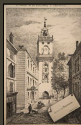
La Tour de l'horloge à la fin du XIX e siècle. Jules de Magallon. Musée du Pavillon de Vendôme, Aix-en-Provence.