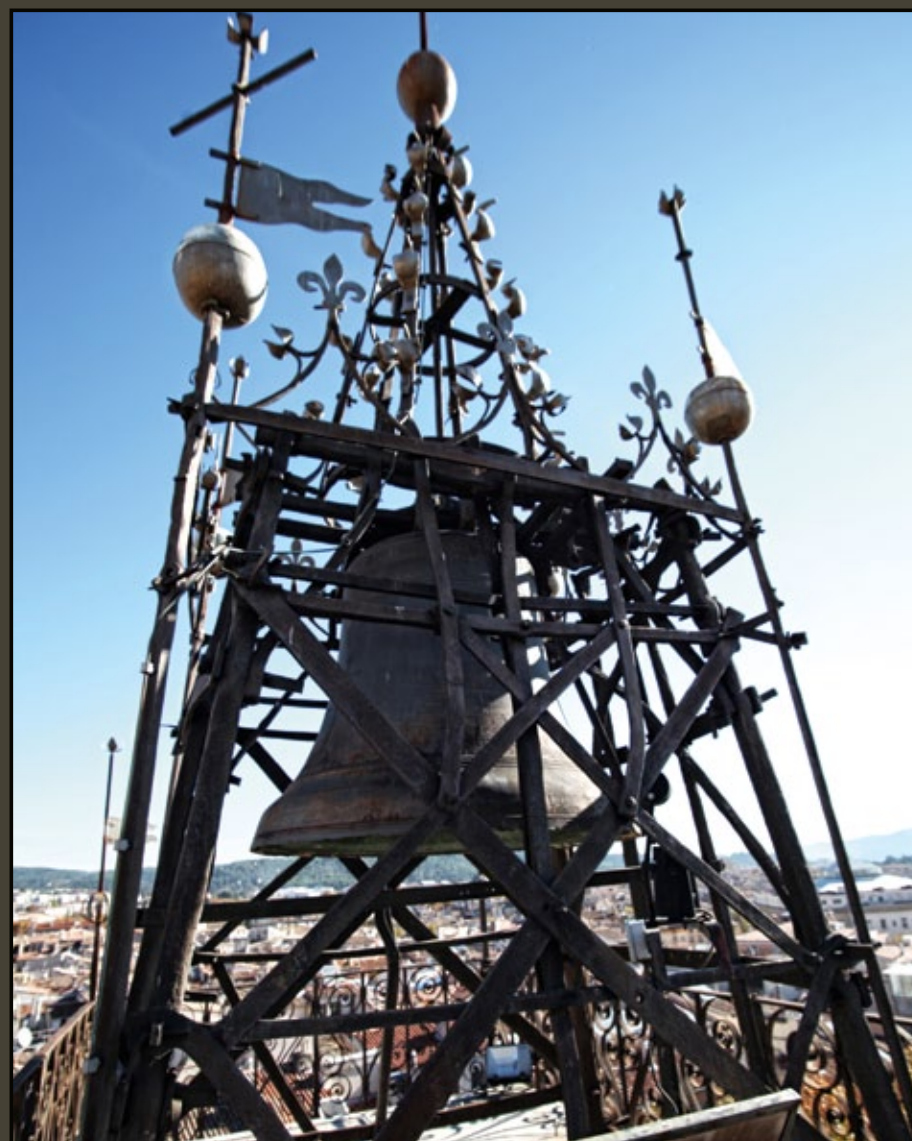
Le campanile en fer forgé.

Au cours des siècles, la Tour de l'horloge connaît diverses transformations : intégration d'un mémorial à Louis XIII (1623), perte de l'aspect défensif par l'enlèvement des éléments fortifiés (parapets, tourelles...) et la mise en place de balustrades en ferronnerie (1661-1662), destruction des emblèmes royaux (1792), reconstitution «fantaisiste» d'un décor néo-gothique flamboyant sur la façade méridionale par l'architecte des Monuments historiques, Jules Formigé (1923).