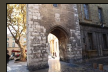
La base de la Tour de l'horloge : ancienne porte médiévale.